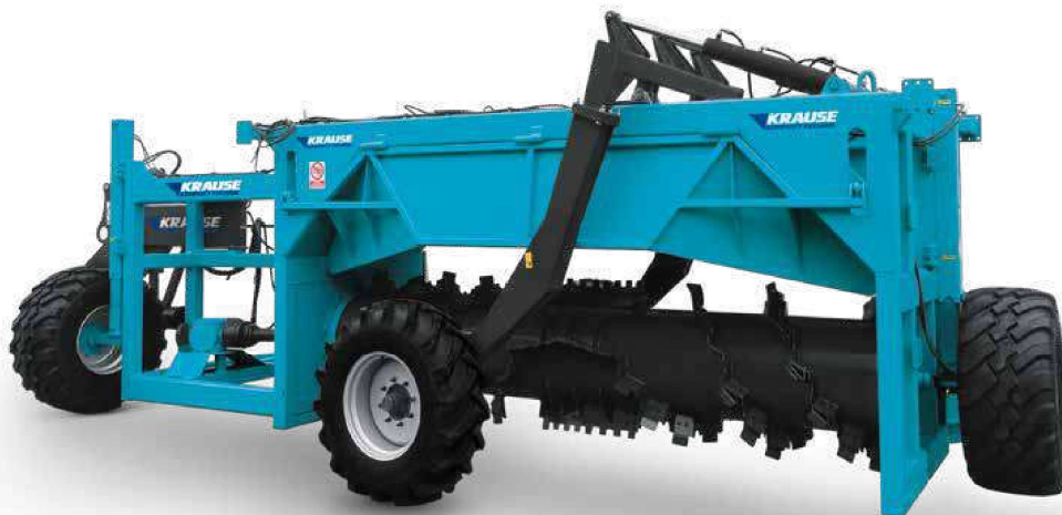
Turners UNI-ROAD 4000 Volteadores UNI-ROAD 4000

Los volteadores UNI-ROAD impulsan el tractor, que funciona en modo rueda libre. Por lo tanto, no es necesario un tractor equipado con una caja de cambios lenta o una transmisión continuamente variable.