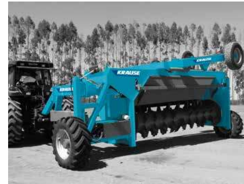
UNI-ROAD WORKING POSITION POSICIÓN DE TRABAJO