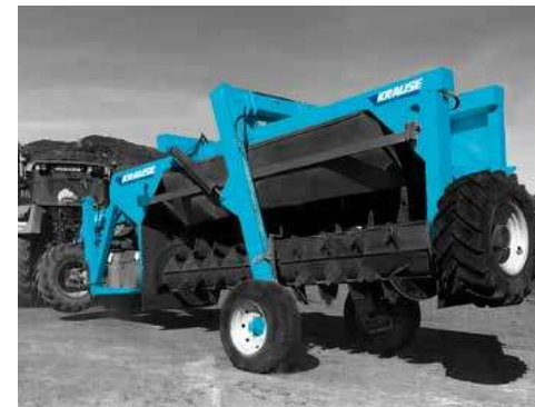
UNI-ROAD TRANSPORT POSITION POSICIÓN DE TRANSPORTE